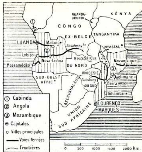
Mapa de Angola con el territorio de Cabinda, separado por el Río Zaire (Congo), Mozambique, las regiones pesqueras más atractivas de las provincias portuguesas de África.

El riesgo puede sobrevenir por dos circunstancias. O porque Portugal entre en el Mercado Común Europeo dejando a España como ahora... a la expectativa. O porque la emancipación político-administrativa de Angola y Mozambique —a con-