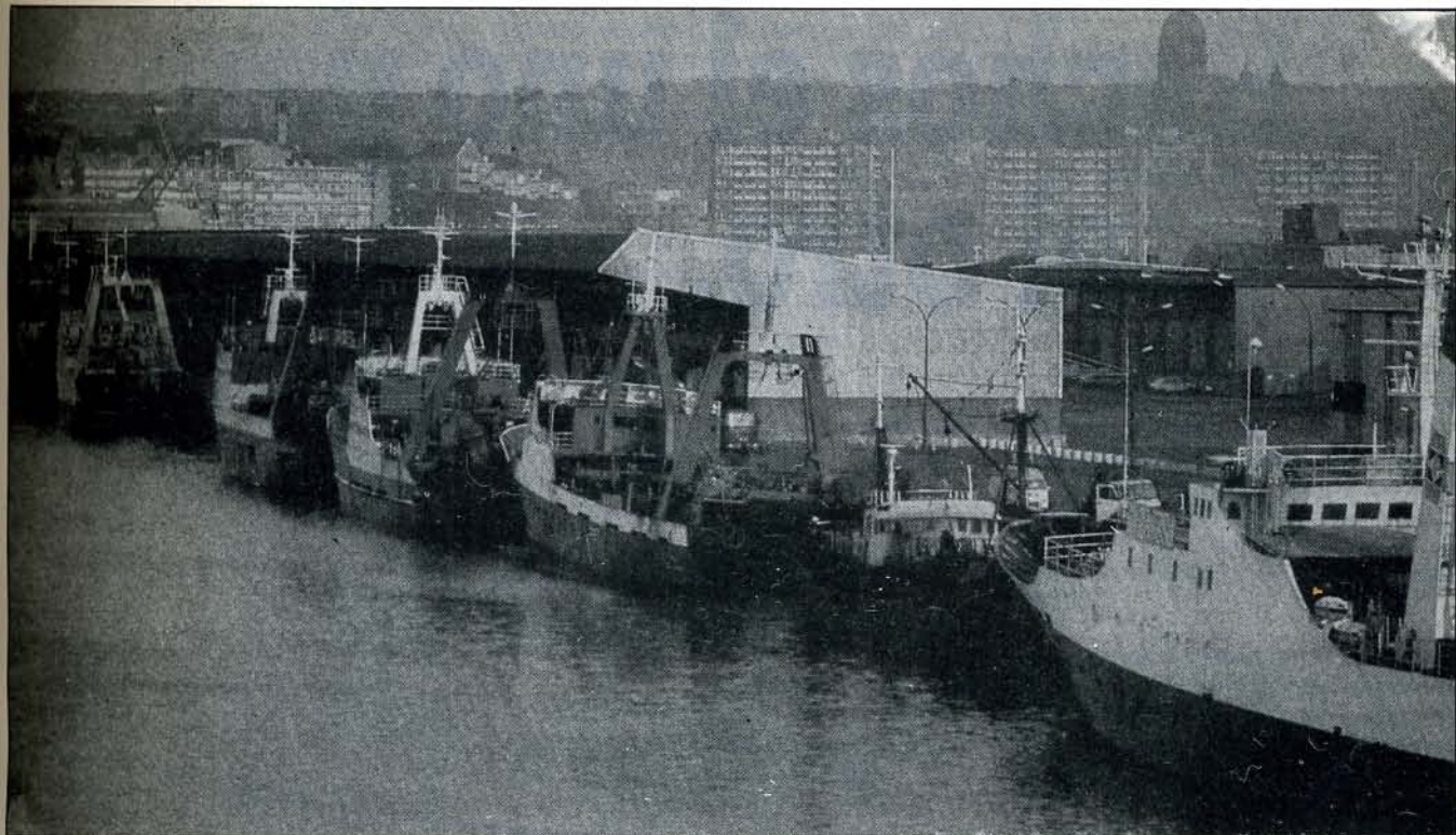
El puerto de pesca más importante de Francia