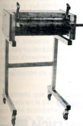
PELADORA PESCADO P 350

Urgell, 41 - Tels. (93) 224 03 76 - 224 57 03 08011 BARCELONA - España Telex 93401 TUMI E