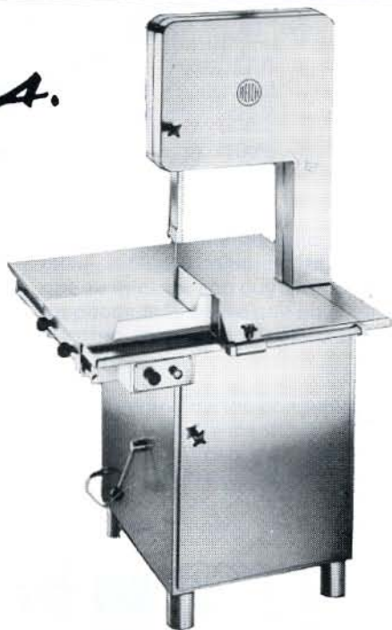
SIERRA CINTA PARA CARNE Y PESCADO. FRESCO Y CONGELADO. MODELO "REICH" 4210.

Todas las piezas que están en contacto con la carne o el pescado son de Acero Inoxidable, evitándose así la corrosión • Carcasa integrada con cubeta para desperdicios del serrín, estimadas en un 25 • Sistema de seguridad provisto en serie con guía de acero protegida y regulable para evitar accidentes • Equipada con regulador de corte para porciones continuas • Un microcontactor en la puerta, frena el motor a la apertura de la misma • La sierra responde naturalmente a todas las exigencias de la legislación de trabajo europeo • Instalación eléctrica y motor en ejecución estanca al agua • Regularidad del funcionamiento absoluto de la cinta • Tensión de la cinta adaptada a una palanca de fijación fácil de utilizarse • Limpieza cómoda y segura • Equipada con plato deslizante y motor de frenado • Cientos de instalaciones en toda España, avalan lo mencionado.