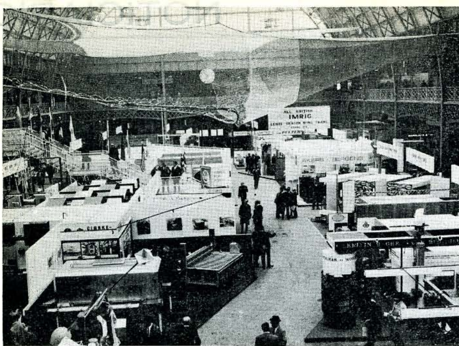
Un aspecto general del National Hall del Olimpia, de Londres a poco de inaugurarse la Exposición.